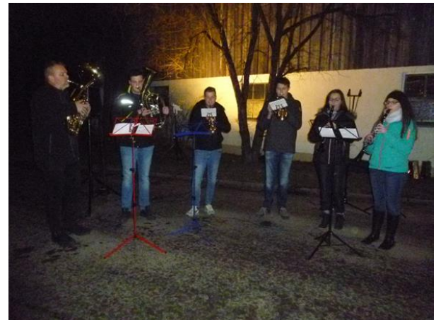
Die Bläsergruppe des Jengener Musikvereins

Für die adventlich musikalische Unterhaltung sorgten wie in den vergangenen Jahren eine Bläsergruppe des Jengener Musikvereins und unsere original Gennachspatzen.