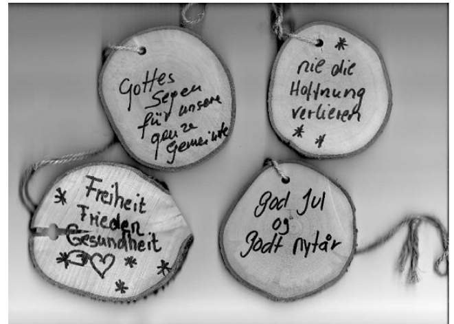
Beispielhaft einige Wunschtäfelchen

Nach dem Abbau des Wunsch-Christbaums sortierten wir die Wunschtäfelchen nach Rubriken. Im Folgenden das Ergebnis der Meldungen nach Anzahl der geäußerten Wünsche: Gesundheit ja – Corona nein, Weihnachtswünsche - auch auf Spanisch und Norwegisch, Zeit und glückliches Leben in/mit der Familie, Friede, Gottes Segen, ein schön geschmücktes Dorf, Glück, ein Schwesterchen, wieder umarmen können, Toleranz, Hoffnung auf eine positive Zukunft u.a.