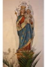
St. Peter u. Paul Dösingen

am 17. Mai 2026 in der Pfarrkirche St. Margaretha Bronnen um 19:00 Uhr