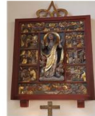
St. Margaretha Bronnen