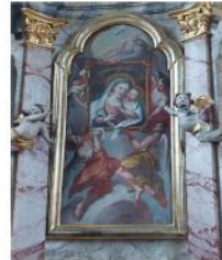
St. Agatha Beckstetten